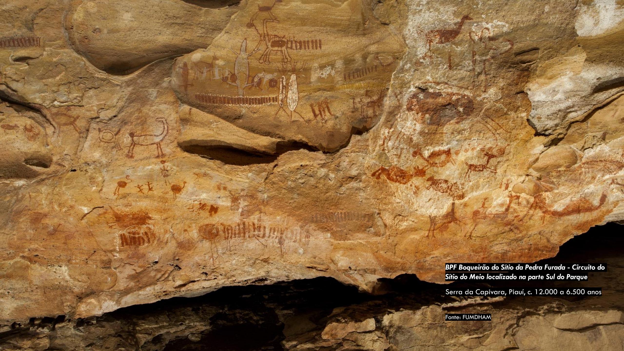
BPF Boqueirão do Sítio da Pedra Furada - Circuito do Sítio do Meio localizado na parte Sul do Parque

Serra da Capivara, Piauí, c. 12.000 a 6.500 anos